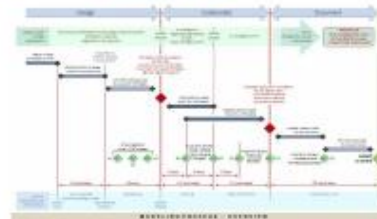
Project Production Management (PPM)