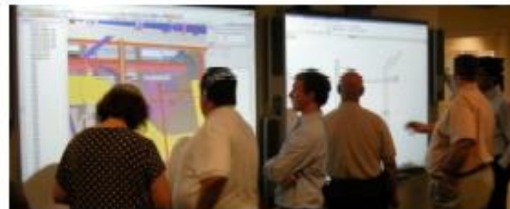
Integrated Concurrent Engineering (ICE)